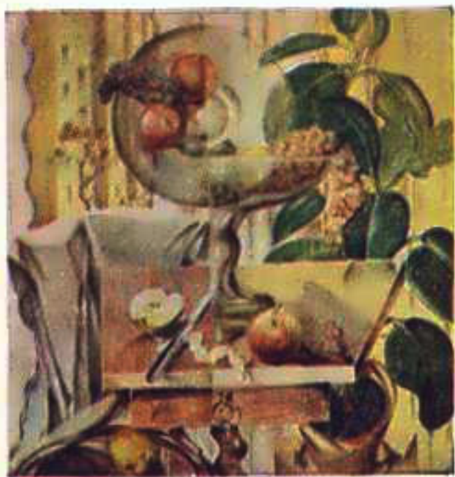
Картини Д. Гриневича.